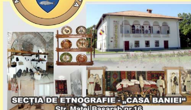
SECȚIA DE ETNOGRAFIE - „CASA BANIEI“ Str. Matei Basarab nr.16