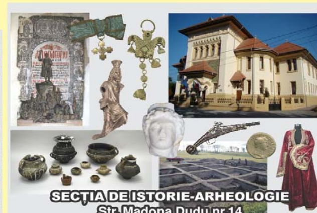
SECȚIA DE ISTORIE-ARHEOLOGIE Str. Madona Dudu nr.14