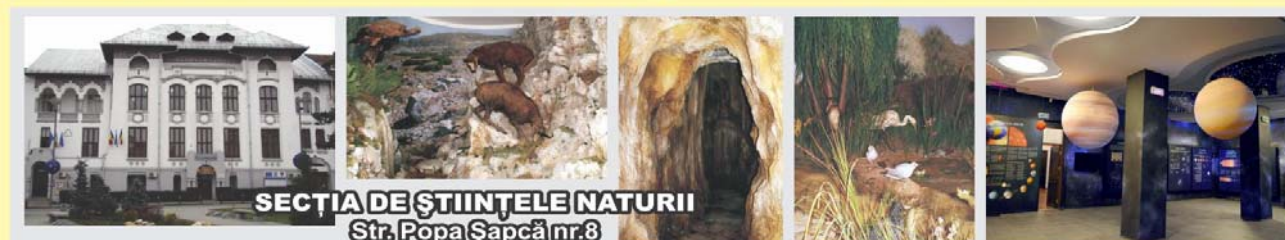
SECȚIA DE ȘTIINȚELE NATURII Str. Popa Șapcă nr.8

Contact: Str. Popa Șapcă nr.8 • Tel.: 0251-417.756 • muzeulolteniei@yahoo.com • www.muzeulolteniei.ro