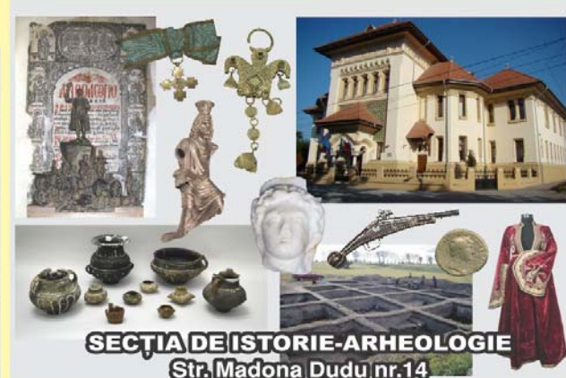
SECȚIA DE ISTORIE-ARHEOLOGIE Str. Madona Dudu nr.14