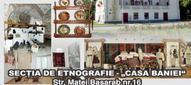
SECȚIA DE ETNOGRAFIE - „CASA BANIEI” Str. Matei Basarab nr.16