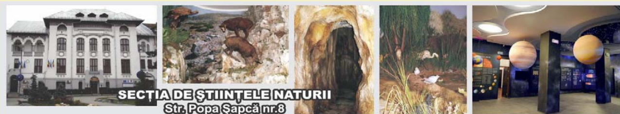
SECȚIA DE ȘTIINȚELE NATURII Str. Popa Șapcă nr.8

Contact: Str. Popa Șapcă nr.8 • Tel.: 0251-417.756 • muzeulolteniei@yahoo.com • www.muzeulolteniei.ro