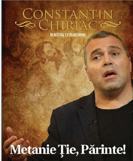
Metanie Ție, Părinte!