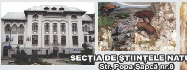
SECȚIA DE ȘTIINȚELE NATURII Str. Popa Șapcă nr.8