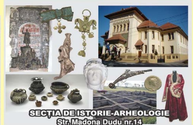
SECȚIA DE ISTORIE-ARHEOLOGIE Str. Madona Dudu nr.14