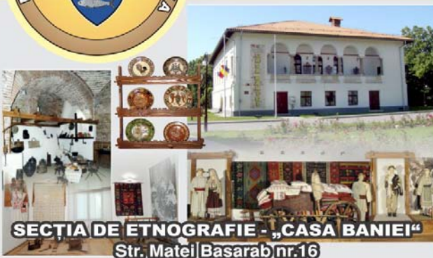
SECȚIA DE ETNOGRAFIE - „CASA BANIEI” Str. Matei Basarab nr.16