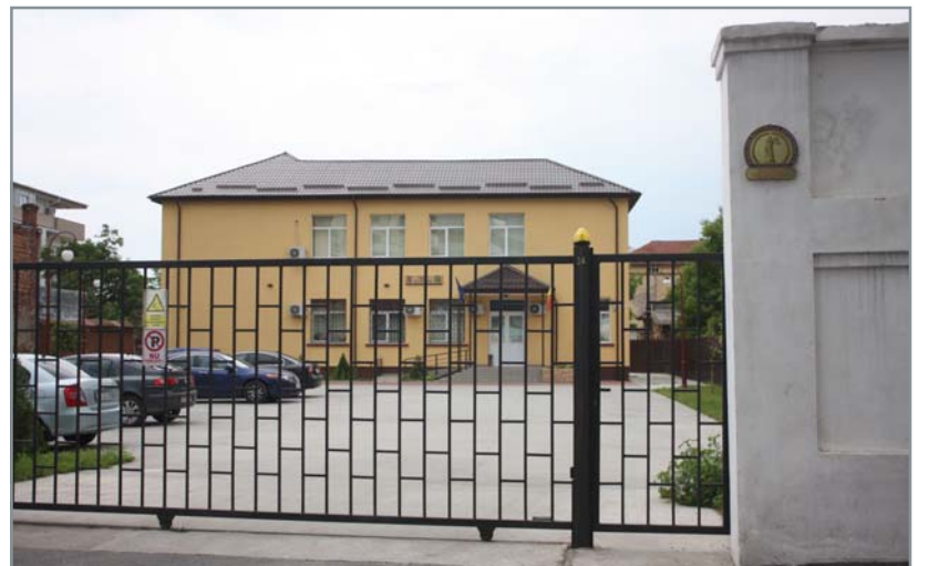
Agenția de Plăți și Intervenție pentru Agricultură s-a constituit parte civilă în cadrul procesului penal cu suma de 2.232.485, 90 lei. Dosarul a fost trimis spre judecare Tribuna-

declarate, a solicitat și obținut de la Agenția de Plăți și Intervenție pentru Agricultură (A.P.I.A.) suma totală de 2.292.485,90 lei. Documentul respectiv era o factura fiscală în valoare de 472.440 euro (fără TVA), emisă de un furnizor extern, care nu corespundea realității, societatea emitentă neefectuând în realitate nicio prestație în favoarea firmei administrată de inculpat”, după cum se arată în comunicatul DNA.