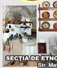
SECȚIA DE ETNOGRAFIE - „CASA BANIEI” Str. Matei Basarab nr.16