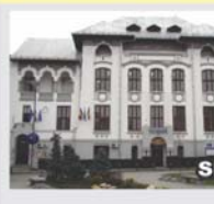
SECȚIA DE ȘTIINȚELE NATURII Str. Popa Șapcă nr.8

Contact: Str. Popa Șapcă nr.8 • Tel.: 0251-417.756 • muzeulolteniei@yahoo.com • www.muzeulolteniei.ro