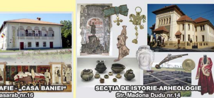
SECȚIA DE ISTORIE-ARHEOLOGIE Str. Madona Dudu nr.14