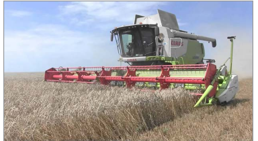
Situația finală a recoltărilor la nivelul județului Dolj a indicat următoarele date:

au verificat un număr de 155 operatori economici, au prelevat 23 probe de vinuri, tescovină și drojdie și au evaluat organoleptic 117 probe de vin. Au fost aprobate două planuri individuale pentru înființarea de plantații viticole pe fonduri europene pentru o suprafață de 2,6 ha. În sectorul viti-vinicol s-a acordat o amendă contravențională de 12000 lei pentru vinuri etichetate neconforme, s-au retras de la comercializare un număr de 413 butelii de vin neconforme; s-au anulat 3 autorizații pentru spații destinate comercializării vinului vrac. Inspectorii Inspecției de Stat pentru Controlul Tehnic în Producerea și Valorificarea Legumelor și Fructelor (I.S.C.T.P.V.L.F.) au efectuat 125 de controale finalizate cu 7 avertismente și 13 amenzi contravenționale în valoare totală de 26000 lei. În sectorul Agriculturii Ecologice au fost înregistrați 81 de producători și un comerciant. Suprafețele înregistrate în