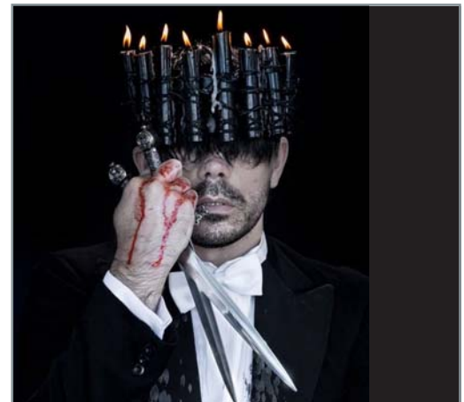
Singura companie independentă de teatru clasic din Africa de Sud, Abrahamse and Meyer Productions, alături de unul din artiștii de vârf ai țării, regizorul Fred Abrahamse, prezintă spectacolul „Macbeth”, sângeroasa poveste a luptei pentru putere, în ceșosul Regat al Scoției.