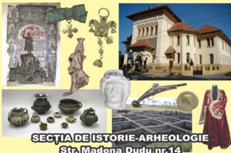
SECȚIA DE ISTORIE-ARHEOLOGIE Str. Madona Dudu nr.14