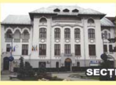
SECȚIA DE ȘTIINȚELE NATURII Str. Popa Șapcă nr.8

Contact: Str. Popa Șapcă nr.8 • Tel.: 0251-417.756 • muzeulolteniei@yahoo.com • www.muzeulolteniei.ro WWW.FACEBOOK.COM/MUZEULOLTENIEI