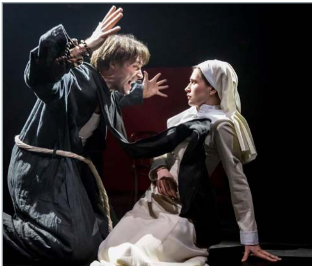
Regizorul britanic Declan Donnellan, alături de faimoasa sa trupă Cheek by Jowl și în colaborare cu Teatrul Pușkin din Moscova, prezintă spectacolul „Măsură pentru măsură”.