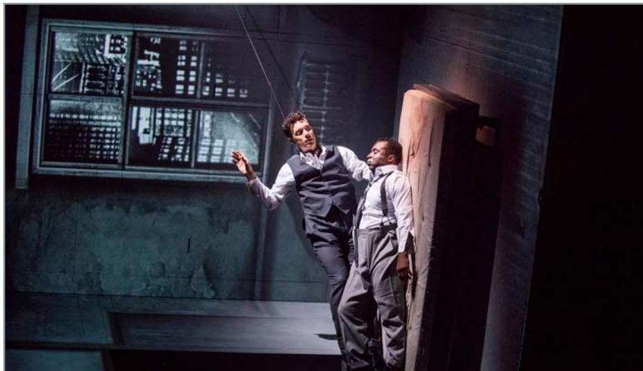
Legendarul maestru al regiei Robert Lepage, alături de faimoasa companie Ex Machina, din Quebec, aduce la Craiova piesa „Ace și Opium”, o producție cu efecte fascinante.