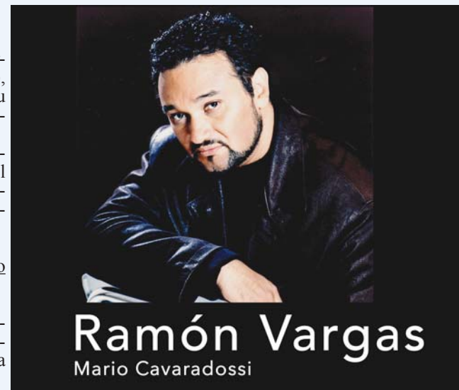
Ramón Vargas Mario Cavaradossi

Rezervările pot fi făcute la numărul de telefon 0351.442.471, la adresa de e-mail agentiadebilet@operacraiova.ro sau pe pagina www.operacraiova.ro .