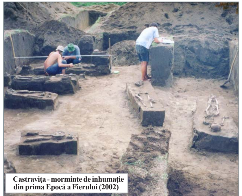
Castravița - morminte de înmormântare din prima Epocă a Fierului (2002)

Alături de specialiștii ai Muzeului Olteniei și ai altor instituții de profil, pe șantierul arheologic de la Desa au venit, de-a lungul anilor, mulți voluntari studenți din țară și din străinătate (Belgia, Marea Britanie, SUA ș.a.), care și-au adus contribuția la