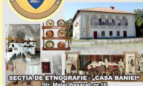
SECȚIA DE ETNOGRAFIE - „CASA BANIEI” Str. Matei Basarab nr.16