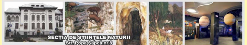
SECȚIA DE ȘTIINȚELE NATURII Str. Popa Șapcă nr.8

Contact: Str. Popa Șapcă nr.8 • Tel.: 0251-417.756 • muzeulolteniei@yahoo.com • www.muzeulolteniei.ro WWW.FACEBOOK.COM/MUZEULOLTENIEI