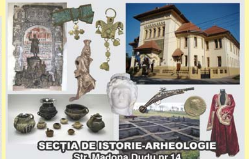
SECȚIA DE ISTORIE-ARHEOLOGIE Str. Madona Dudu nr.14