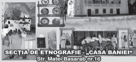
SECȚIA DE ETNOGRAFIE - „CASA BANIEI” Str. Matei Basarab nr.16