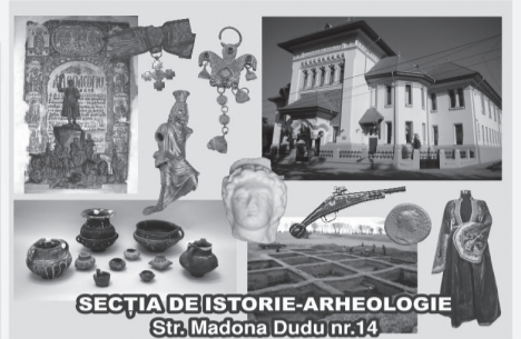
SECȚIA DE ISTORIE-ARHEOLOGIE Str. Madona Dudu nr.14