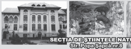
SECȚIA DE ȘTIINȚELE NATURII Str. Popa Șapcă nr.8

Contact: Str. Popa Șapcă nr.8 • Tel.: 0251-417.756 • muzeulolteniei@yahoo.com • www.muzeulolteniei.ro